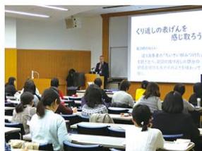
2019年冬の勉強会 ワークショップの様子