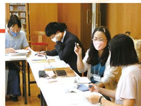
2023年グループ研修の様子