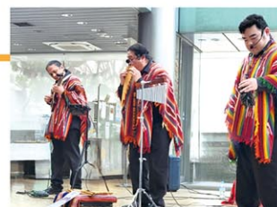
ゲスト講師: フォルクローレ演奏グループ ウィニャイ (WIÑAY)